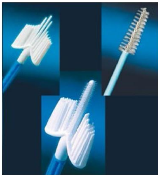
Рисунок 1. Вид рабочей части щеток для получения адекватного материала как с экто-, так и из эндоцервикса. Материал должен быть получен либо двумя щетками (А, Б), либо комбинированной щеткой с эндоцервикальным компонентом (В).

Правила забора традиционного мазка на онкоцитологию: